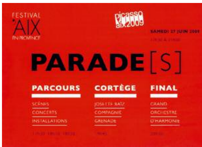
Flyer für die PARADE[S]